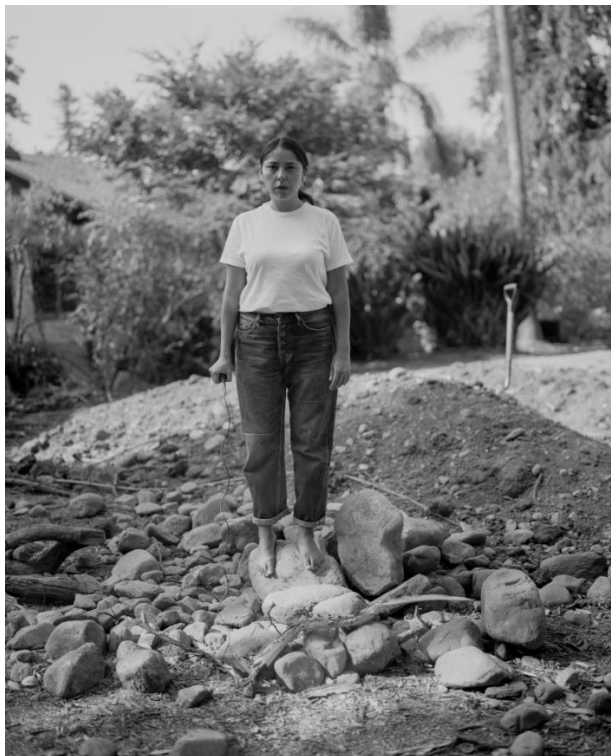
صخره‌ای از استخوان‌های بسیار، صخره‌ای که شکم را از گرما پر می‌کند (۲۰۲۰)

او میراث ماندگار ساختارهای قدرت استعماری را مسئول سرکوب، محو و سلطه بر بدن‌ها و فرهنگ‌های بومی می‌داند. او از بدن 'فرانزادی' خود به عنوان ابزاری قدرت‌مند برای دخالت در تصویرهای تاریخی و نوشتن تاریخ واقعی نو استفاده می‌کند.