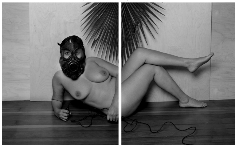
عکس از خود (خویش‌نگار) از مجموعه اتاق تاریک عریان‌های وستون - ۲۰۲۰

در عکس‌ها از مجموعه‌ی ۲۰۰۵ تا ۲۰۲۳ ۵ نیز همین را می‌بینیم. مجموعه‌ای که خود را سال‌ها اسیر به اصطلاح 'ژست‌های زنانه' کرده. نمونه‌هایی از مد، تکنگرایی‌های هنرمندان و مجله‌های قدیمی الفیه شلفیه. برخی از ژست‌ها ناخوشایند به نظر می‌رسند و نکته‌ی کراچناک درست همین است: تن. او در قالب ایده‌آل‌های زیبایی غربی نمی‌گنجد. اما تصویر ایده‌آل چگونه شکل می‌گیرد. ما به تن زن چگونه نگاه می‌کنیم؟ زنان خود را چگونه نشان می‌دهند؟ چگونه می‌توانیم تعریف نوینی از هنجار، معیار و قدرت به دست داده و فضا را گسترش دهیم؟ تعداد زیادی از عکس‌ها در حرکت گرفته شده‌اند: دهان باز است، دست‌ها در حال رها کردن چیزی که محکم گرفته‌اند. ایستاده با دست‌ها رو به آسمان، دراز کشیده با تن منقبض، در تنش با خود تا سر پا بایستد. تن. پویا.